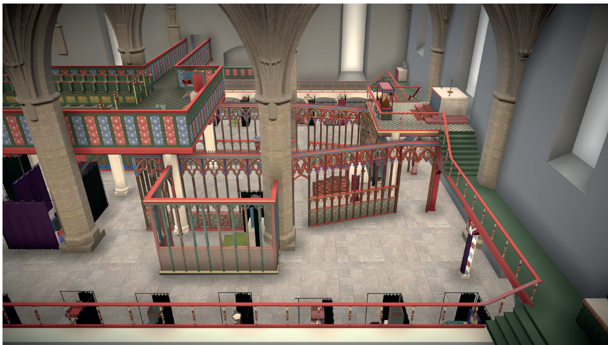
Bild 71. Detalj från digital 3D-rekonstruktion av klosterkyrkans östra delar med nunnekoret till vänster och i mitten Birgittakapellet. Till höger ses hur den östra delen av sidoläktarna leder upp till Mariakoret. I bakgrunden skymtar herrskapsläktaren på den norra sidan. © förf. och Carolina Ask.

Kanske stod transportskrinet på baksidan av Birgittaaltaret, så att man defilerade förbi båda skrinen när man passerade bakom altaret. Sina gåvor till jungfru Maria kunde man möjligtvis lämna under hennes kor, dvs. vid östväggen alldeles bakom Birgittaaltaret.