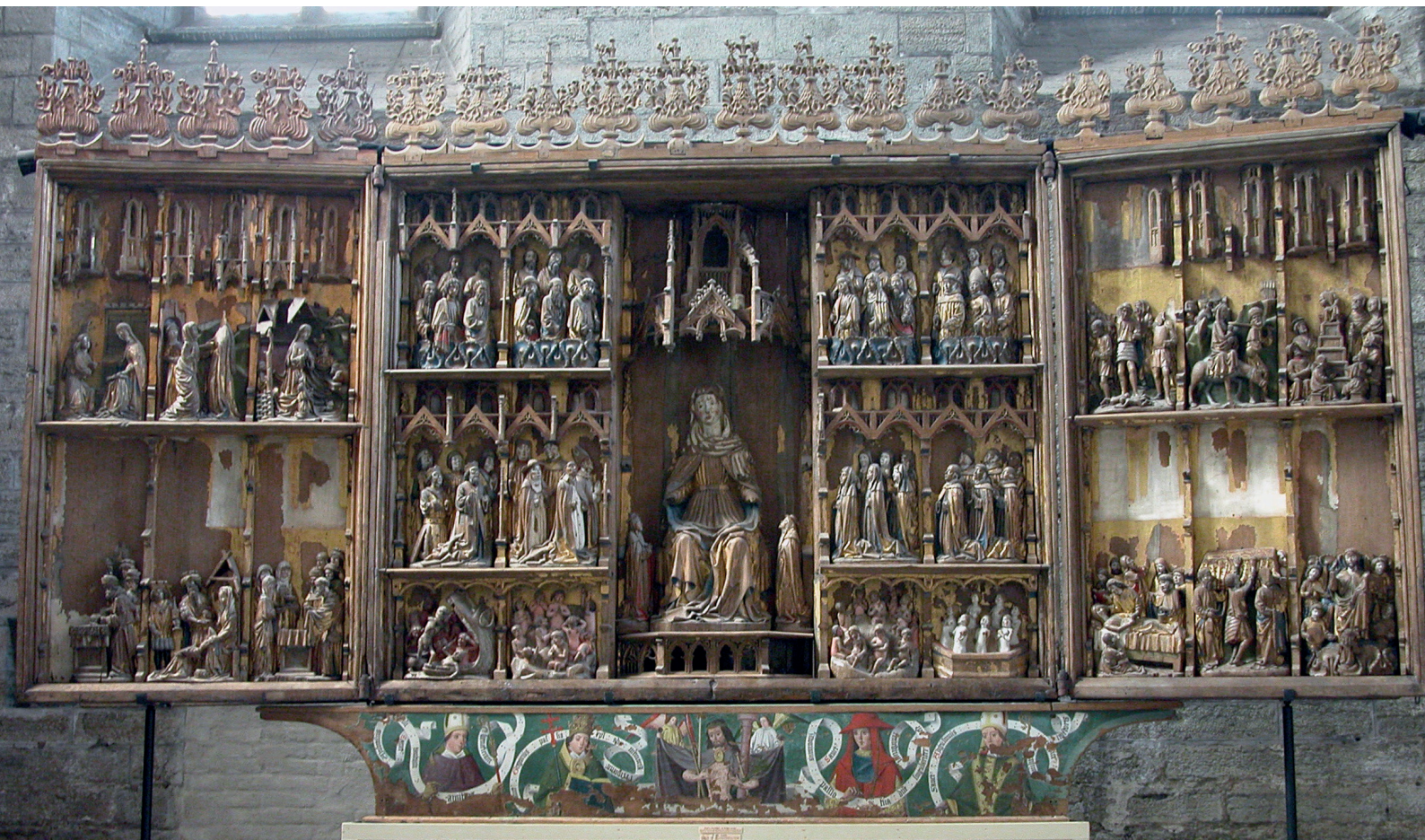
Bild 66. Birgittaaltarskåpet. Skåpet beställdes från Lübeck och invigdes 1459. Det har skulpterade insidor med förgyllda fonder. På flyglarnas utsidor fanns målade scener.