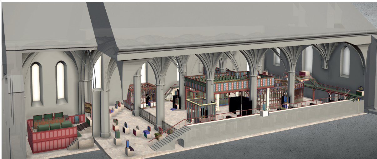
Bild 69. Rekonstruerad översikt av den medeltida kyrkans interiör omkring 1470.