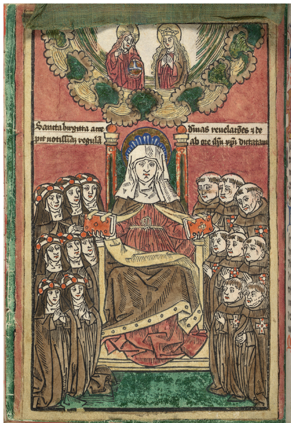
Bild 67. Miniaturen visar heliga Birgitta sittande på en tronsol, flankerad av sina ordenssystrar och bröder. Hon överlämnar klosterregeln till dem, enligt inskriften i bilden. I ett moln över henne ses Kristus och jungfru Maria. Kolorerat träsnitt på papper. Bilden är inklestrad på baksidan och skyddas av en tunn grön silkesgardin som kan fällas undan så att man ser motivet. KB A 12 f. 129v.

har inget av dessa båda viktiga platser lämnat några fysiska spår efter sig i rummet. Genom den rumsligt sett triangelformade placeringen av de tre birgittinskt förknippade individernas altare/gravar skapas en rotationsmöjlighet i kyrkorummet. Birgittas altare kommer besökaren till nästan direkt innanför kyrkportarna. Därifrån leds besökaren vidare in i kyrkan, bort mot högkoret i väster. Effekten blir ett ståtligt arrangemang där högaltaret och de tolv apostlarnas altaren, bakom järngallret, flankeras av magister Petrus och saliga Katarinas respektive gravar och altare intill gallret. (Bild 49.) Genom spridningen i kyrkorummet skapas också en cirkulation för pilgrimerna, ett flöde, så att inte alla stannar upp på samma ställe. Det ambulatorium som man skapade i de gotiska katedralernas kor får här sin funktionella motsvarighet.