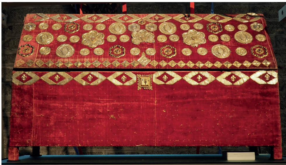
Bild 64. Det röda sammetsklädda relikvieskrinet som heliga Birgittas kvarlevor vilade i fram till 1412 och dottern Katarina skrinlades i 1489. Skrinet har varit helt översälat med förgyllda silverbleck med olika reliefmotiv, varav många nu saknas. Längd 63,5 cm, höjd 117 cm, djup 39 cm.