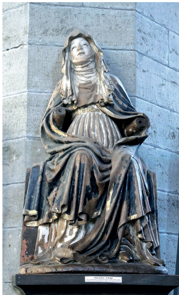
Bild 65. Klosterkyrkan har två skulpturer som föreställer heliga Birgitta. Den "porträttilika" respektive den "extatiska". Den förstnämnda är gjord av al och dateras till sent 1300-tal och den senare är av ek och dateras till ca 1435. Deras ursprungliga placering i klostret/kyrkan är okänd.

Ännu ett skrin har haft en prominent roll i klosterkyrkan: det röda sammetsskrinet. (Bild 64.) Skrinet hyste heliga Birgittas relikier åren 1381–1412, och från 1489 förvarades dottern Katarinas relikier i det. Det innebär att det aldrig varit uppställt i den nuvarande kyrkan med heliga Birgittas relikier i, men däremot med Katarinas. Skrinet visar inga tecken på den typ av slitage på sammeten som kunde förväntas, om det hade varit tillgängligt för pilgrimernas beröring under lång tid. 648 Möjligen var skrinet placerat synligt men inte berörbart under de exponerade perioderna. Man kan t.ex. tänka sig en upphöjd placering direkt bakom altaret i Katarinakapellet.