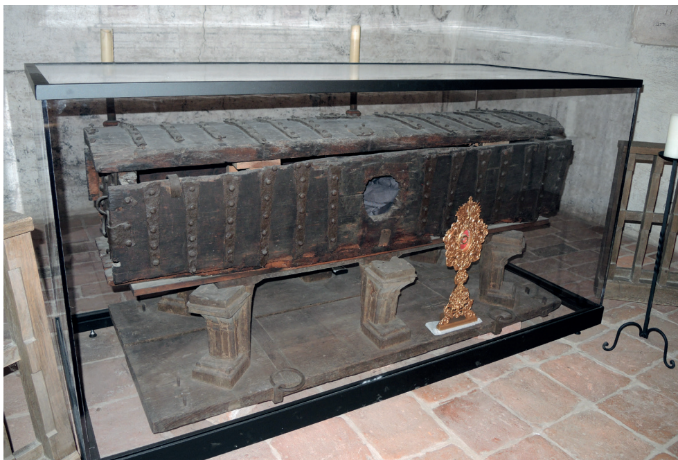
Bild 63. Träkistan som heliga Birgittas kvarlevor fraktades ifrån Italien till Sverige 1373–74. Kistan står numera i klostermuseet.

för både nunnorna, lekfolket på kyrkgolvet och herrskapet på sin läktare. Heliga Birgitta skulle då själv få en prominent placering nära Mariaaltaret, mellan jungfru Maria och nunnorna. Hon skulle hamna i nunnornas blickfång mot öster och hon skulle så att säga gå före dem mot uppståndelsen, i Marias efterföljd. De enda som i så fall inte kunde se skrinet från sitt kor var bröderna, eftersom nunneläktaren och högaltaret skymde sikten för dem. Däremot kunde de komma riktigt nära skrinet i samband med mässfirandet i Mariakoret.