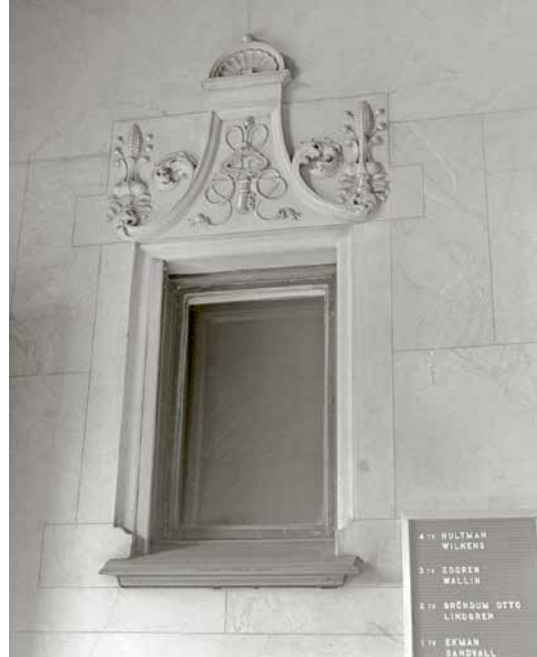
Portvaktsslucka från Strandvägen 29.