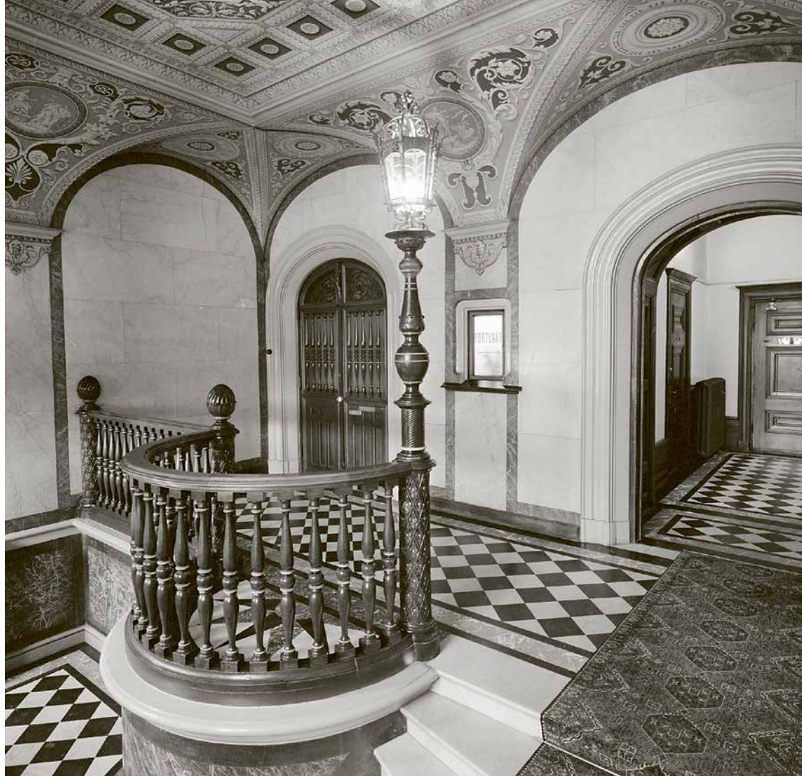
Portvaktsslucka från Strandvägen 33. 1973.

status och identitet. Samtidigt fick andra, dolda av innergårdens väggar, ta sig in i fastigheten via kökstrapporna. 42