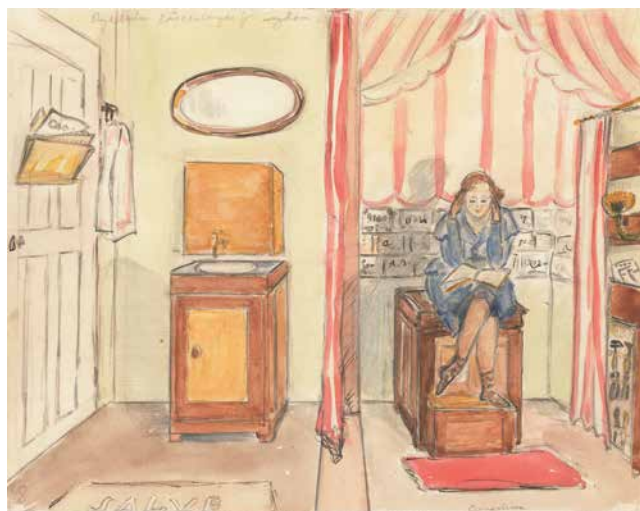
Akvarell, ”Läsesalongen på dass”, av AnnaStina Alkman, 1965. Stadsmuseet i Stockholm, AnnaStina Alkmans samling.

farligt romskåp. 101 Men i det här sammanhanget är det torrdassets entréer som är intressanta. Det fanns nämligen två. En som ledde ut mot köket, och en annan som öppnade sig mot en inre hall i våningen. 102 Detta var latrinhämtarnas dörr och genom att använda den förkortades deras väg genom våningen. En liknande lösning som gjorde att de inte behövde gå in i våningen över huvud taget var varianter där en av toalettens dörrar kunde öppnas direkt från fastighetens trapphus. 103 De enda spår latrinhämtarna då lämnade efter sig var en