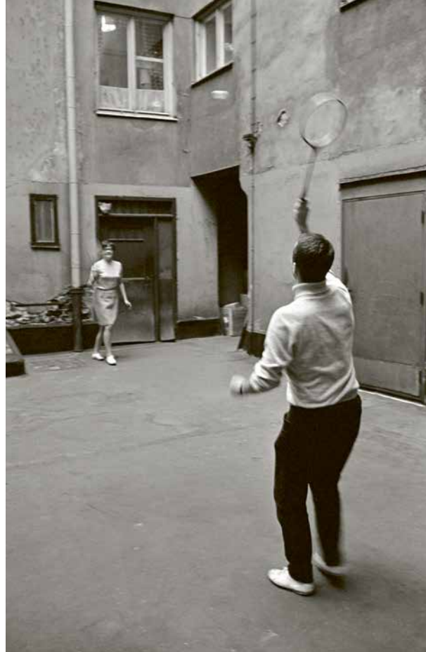
Höger: Troligen Norra smedjegatan 20 (Hotell Garni) eller 22. Badmin- tonspel på bakgård.

För att hitta vad som med sociologen Henri Lefebvres terminologi är det konceptualiserade rummet – det planerade, iscensatta och regisserade rummet – måste man se både till platsens materialitet och till myndigheternas hanterande av densamma. 8 Det material jag har att tillgå är dels bilder och beskrivningar av Norra smedjegatan som plats, vilka återfinns i Stadsmuseet i Stockholms samlingar i form av fotografier och byggnadsinventeringar, dels det omfattande material som återfinns i besiktningsbyråns och sedlighetspolisens arkiv, och de avtryck Norra smedjegatan gjort i politisk debatt och agerande.