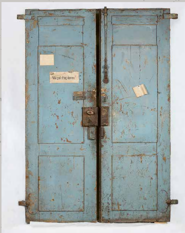
Sedlighetspolisen grep ofta kvinnor för prostitution på hotell Linden.

När Klarakvarteren revs under senare delen av 1900-talet inventerades husen av I några fall samlades också föremål in. I museets samlingar finns kakelugnar, fönsterkarmar, dörrvred, dörrar och andra lämningar efter byggnader som raderats från stadslandskapet. Dörren till vänster är från hotell Linden på Klara västra kyrkogata 21, som revs 1956. Under många år var Linden i likhet med Garni och övriga hotell längs Norra smedjegatan ett så kallat partihotell, där sedlighetspolisen hämtade in kvinnor. Inventering, föremålsbeskrivningar och katalogkort berättar ingenting om den historien. Fotografierna och föremålen i sig rymmer dock ledtrådar till det försvunna. Fotografierna uppvisar ett enkelt hotell med små rum och smala järnsängar. Dörren är tagen ur sitt historiska sammanhang. Till skillnad från dörren i ett bevarat och renoverat hus vittnar det dock genom sina lager av färg, kvar- glömda skyltar, hårt slitage och flertalet låsmekanismer både om husets utveckling och om dess förfall.