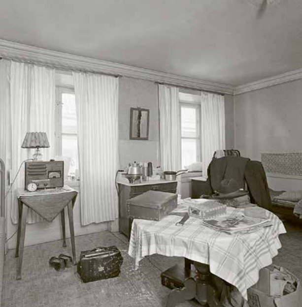
Interiör från ett bebott rum på hotell Linde. 1956. SSMFo65923.