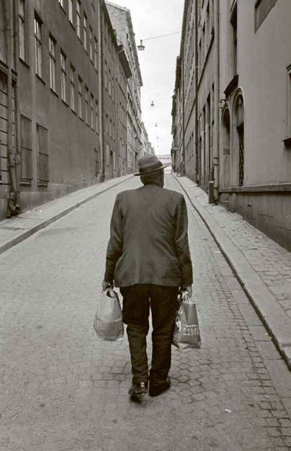
Vänster: Man på väg upp- för Norra smedjegatan norrut mot Hamngatan.