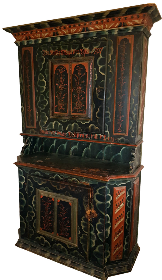
Figur 1 (2.4.1): Skåp signerat "Målat av Mats Dahlström ifrån St Tuna". I privat ägo.

re. Hans av allt att döma omfattande produktion från 1790-talet och fram till första åren på 1800-talet bidrog i hög grad till att befästa stilen i socknen.