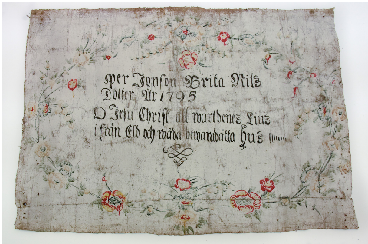
Figur 3 (2.4.3): Del av interiört måleri från en gård i Nor, Järvsö socken. HM 771.