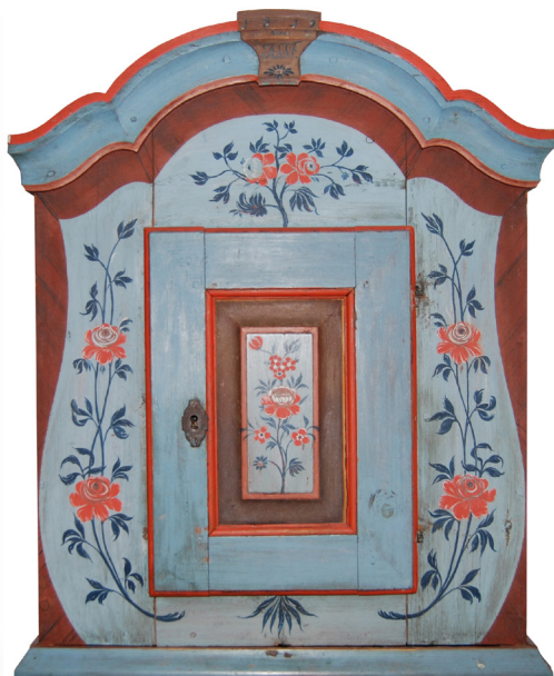
↗ Figur 15 (2.4.15): 1819 med signatur på insidan av dörren. Att göra en svängd form på framsidan som avgränsat av brunådrade kanter var ett sätt att åstadkomma en effektfull rokokoform utan att behöva göra svängda kanter på skåpet. Privat ägo.

en klart blå färg. Märk hur de två stjälkarna möts i rundeln och att de strax innan har hopdragits av en ring. Hälsinglands museum.