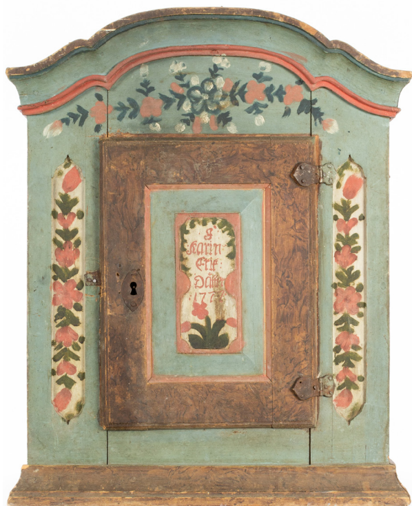
Figur 5 (2.4.5): Hängskåp daterat 1777 på dörrspegeln. Detta är det äldsta daterade exemplet på hängskåp av den äldre Forsa-modellen. Skåpet har proveniens Hög, vilket sedan gammalt är annexförsamling till Forsa. Hälsinglands museum.