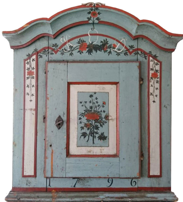
↑ Figur 12 (2.4.12): 1796. Märkt: "KOD". Notera hur mittinitialen "O" är upphängd i en krok från blomman på krönet. Privat ägo.