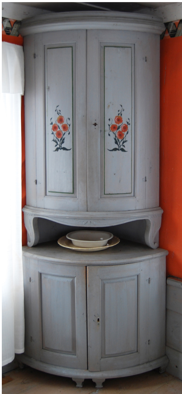
Figur 6 (2.4.6): Skänkskåp av yngre Forsamodell, daterat av Jonas Lust 1838. Signaturen måste tolkas som tillhörande snickeriet. Ystegårn i Hillsta, Forsa.