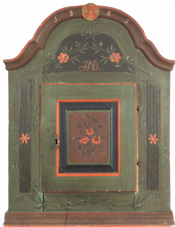
↓ Figur 16 (2.4.16): 1823. Märkt: "AND". Skåpet är nu grönt men innan fernissan gulnade hade det