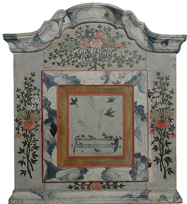
↓ Figur 13 (2.4.13): Omkring 1800. Det icke daterade enda kända skåpet med svängda sidor. De skurna rocaillerna, som är extra många här, återfinns även på det stora skåpet från år 1800. Privat ägo.