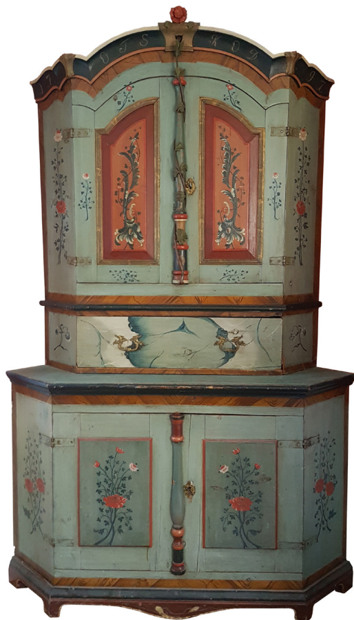
Figur 7 (2.4.7), till vänster: Skänkskåp målat och snickrat av Jöns Månsson i februari–mars 1800 enligt signatur. Hälsinglands museum.