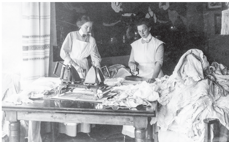
Bild 7.1. Interiör från ett borgerligt hem i Göteborg omkring 1910. På denna bild hettar tjänarinnor upp strykjärn på en särskild värmare.

välbeställda familjer vant sig vid. Som dottern till en biografägare i Göteborg konstaterade när hon såg tillbaka på sin uppväxt under 1940-talet, att hennes föräldrar ”alltid hade hjälp i huset, aldrig behövde tacka nej till en bjudning eller resa, aldrig behövde jäkta för att hinna få disken färdig till TV-Aktuellt”. 3