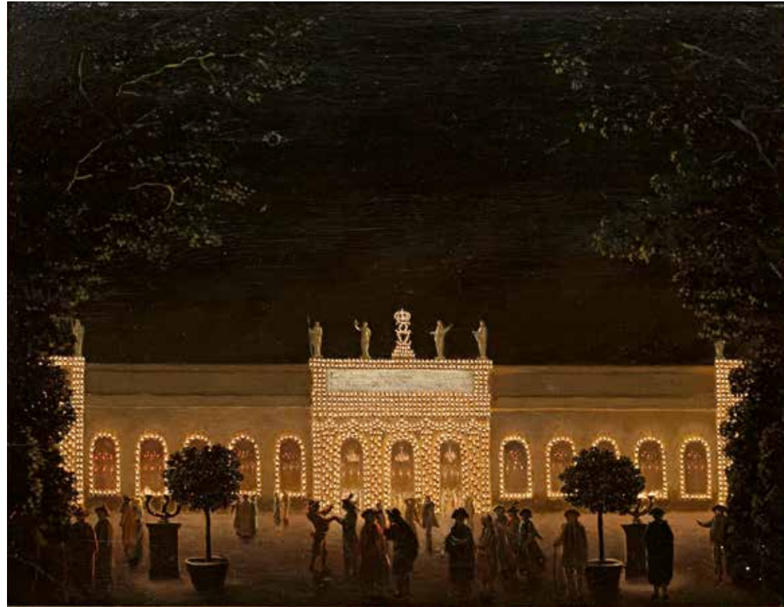
Pehr Hilleström. Vauxhall, illuminerad vid borgerskapets fest den 21 augusti 1791.