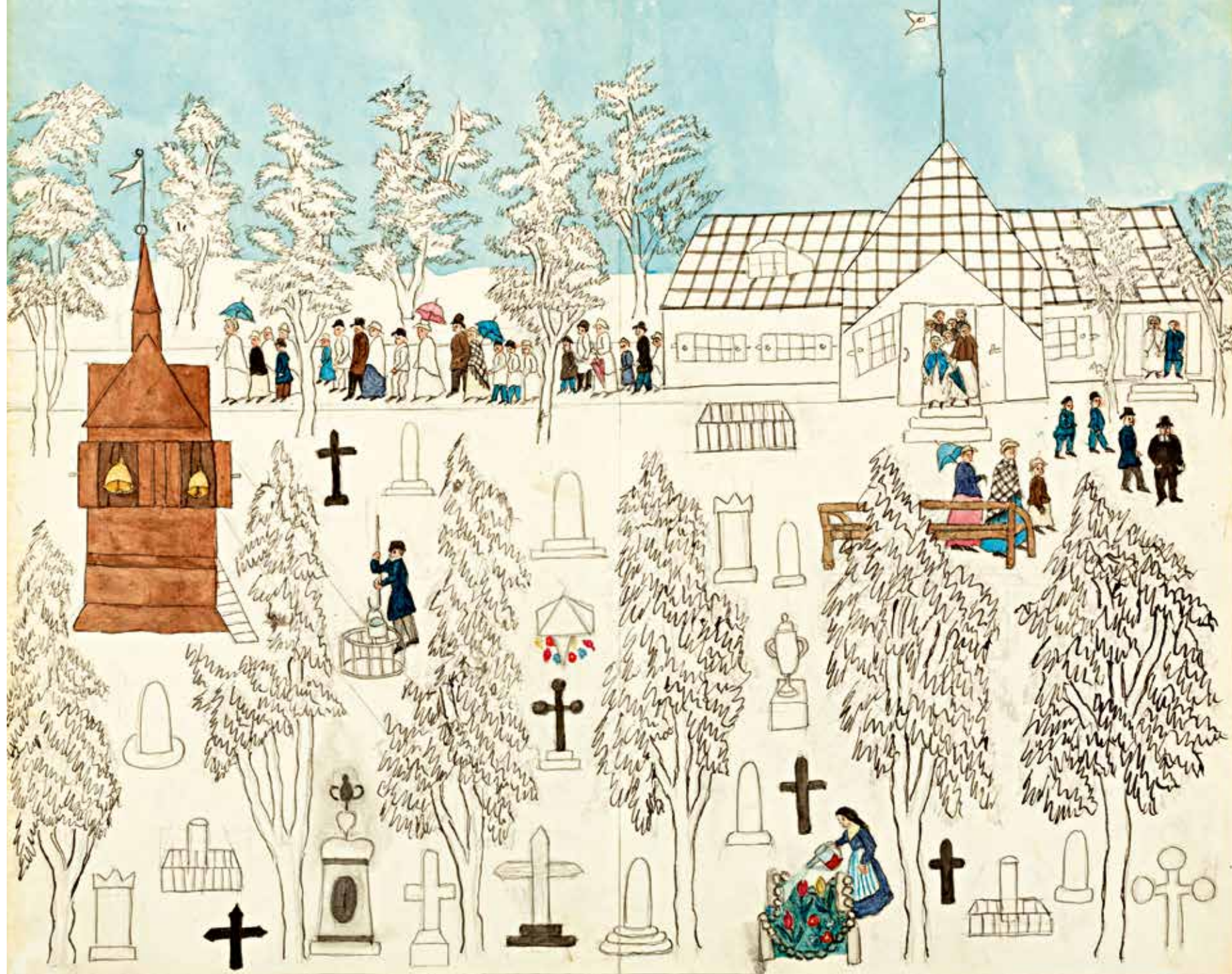
Johannis kyrka och kyrkogård.