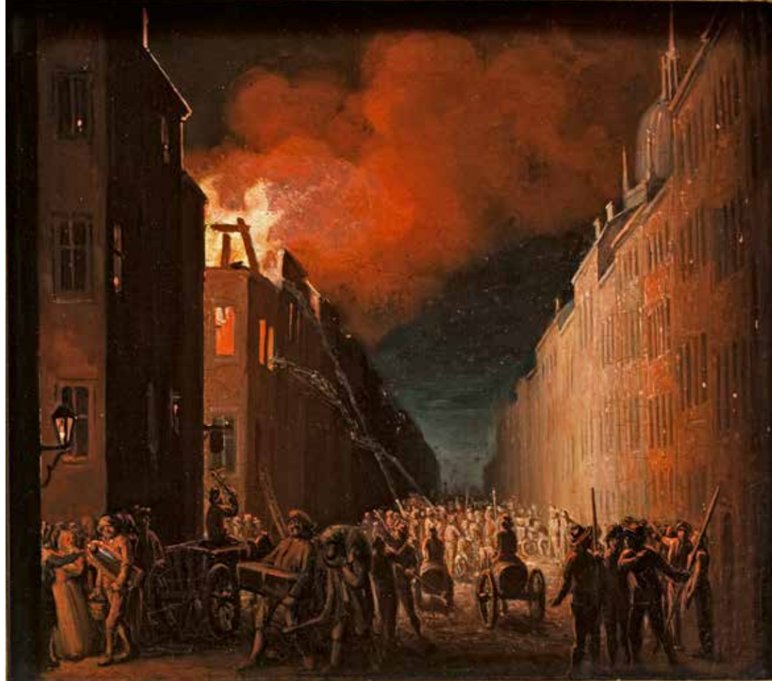
Pehr Hilleström, Branden på Högbergsgatan, omkring 1790.

Eld och ljusfenomen har liksom ruiner en lång kulturhistoria. Tillfällesarkitektur, illuminationer, fyrverkerier och ljusspel ingick sedan länge i de kungliga fester och ceremonier som hovet lade stora pengar på att gestalta konstnärligt. Med mönster från hoven i Europa smyckades staden till fest vid kröningsintåg, begravningar och dop eller till fredens bevarande i krigstid. 350 Ceremonierna överfördes