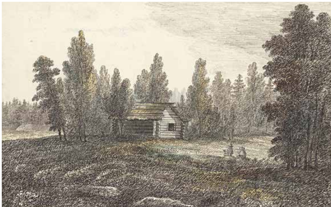
Axel Fredrik Cederholm, "Hölada vid Nordsjön i Kulla socken", 1811. Uppsala universitetsbibliotek.

Det blir också tydligt hur mycket information som teckningen förmedlar om kulturlandskapet jämfört med kartan. En rad detaljer och element i kulturlandskapet framkommer i teckningen – växtlighetens utbredning och karaktär, bebyggelsens utformning och storlek, nivåskillnader i landskapet, hägnader, gärdesgårdar med mera. Kartan är en abstraktion, en tolkning av