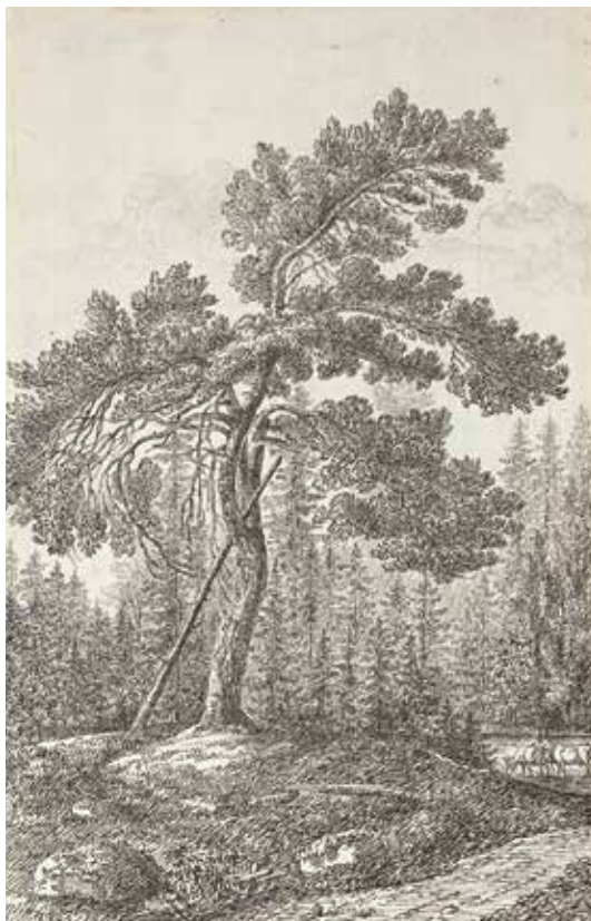
”En tall wid Huggboda. Tecknat efter naturen av A. F. Cederholm 1814”. Uppsala universitetsbibliotek.

en tecknare – sig själv – i bilden. Han sitter med ryggen vänd mot betraktaren, klädd i hög hatt och frack, och med ett pappersark i knät. Genom