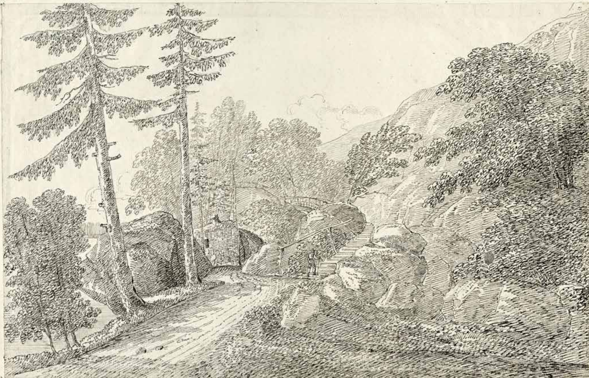
Groffan: Rosersbergs Trädgård Etched for nature of A. F. Cederholm 1816.