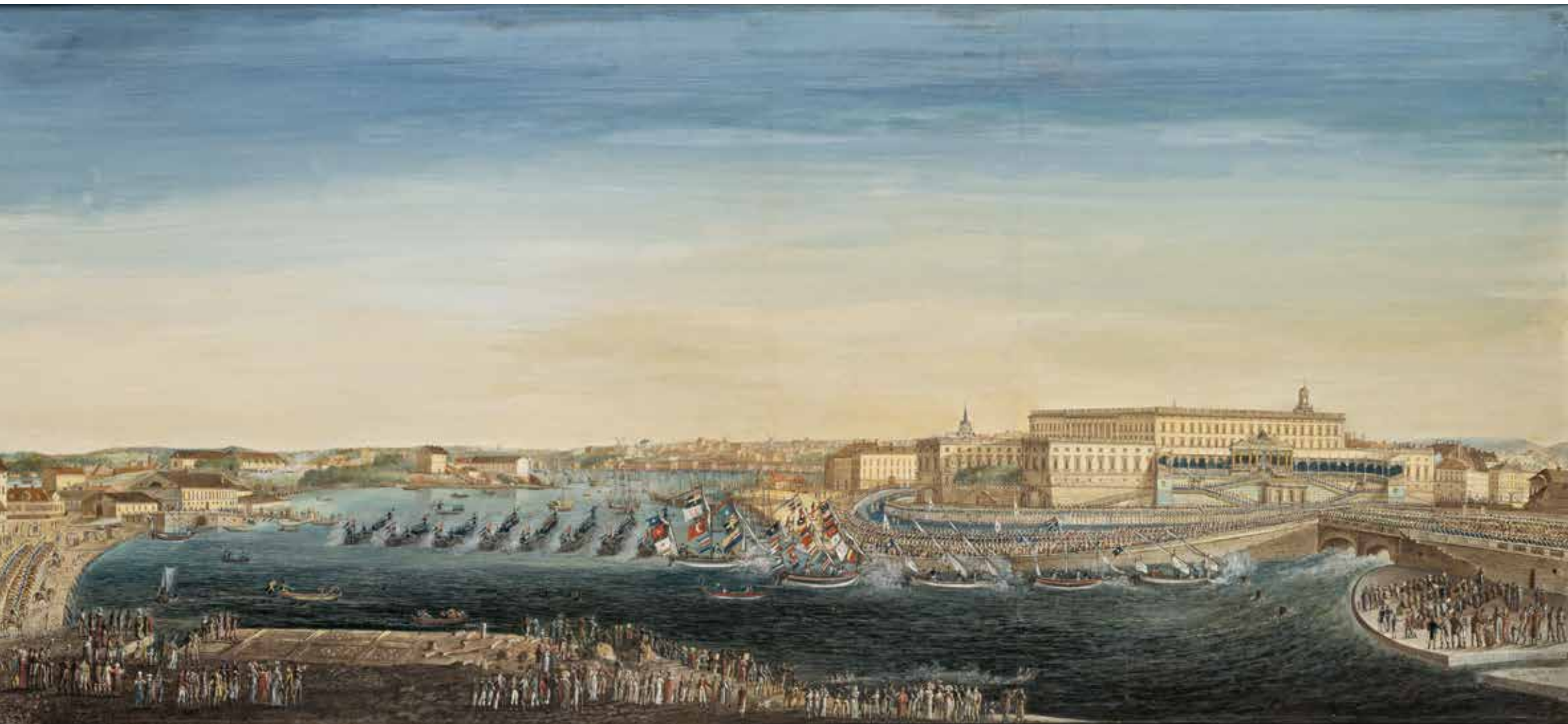
Axel Fredrik Cederholm. "Kung Karl XIV Johans hyllning", 1818. Gouache på papper. Nationalmuseum.