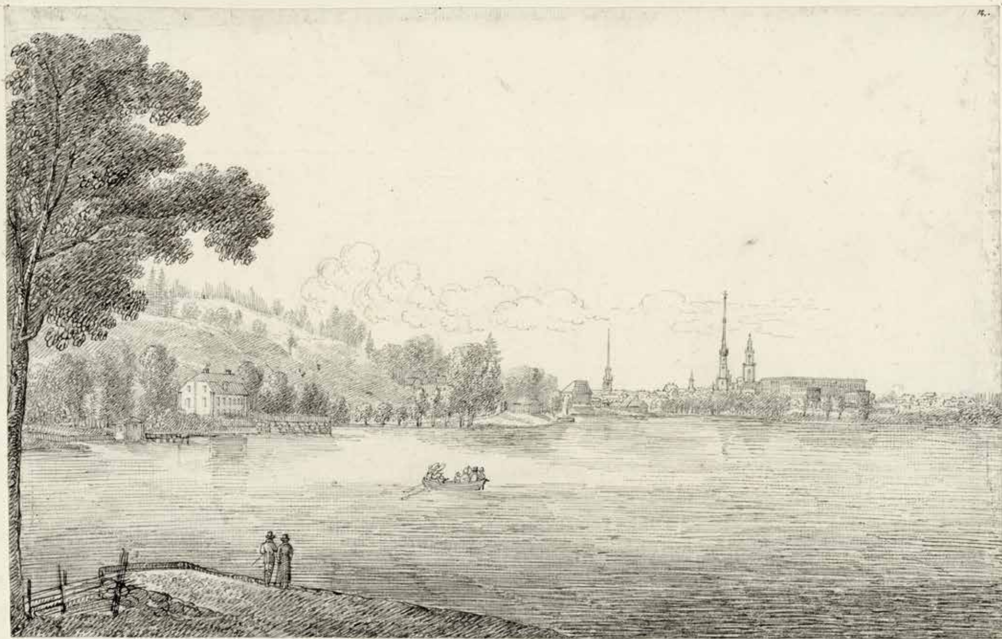
Sirishof på Kongl. Djurgården. Tecknad för naturen af S. F. Cederholm 1810.