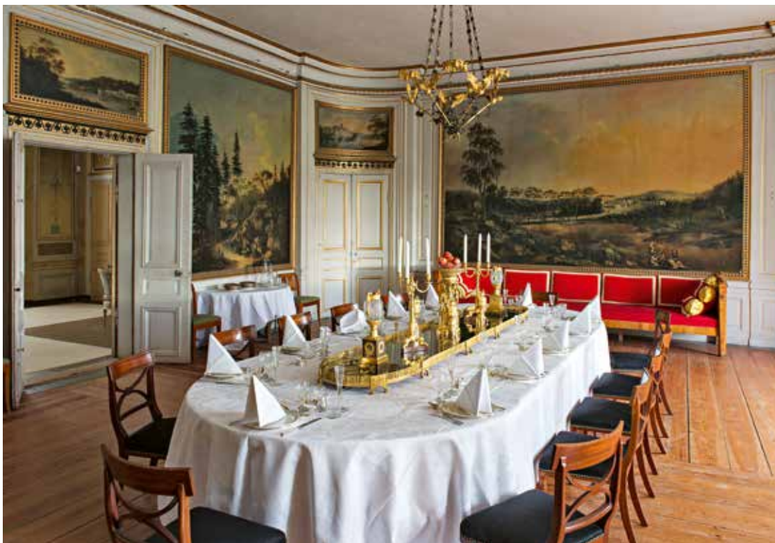
Rosersbergs slott ligger vid en vik av Mälaren norr om Stockholm. Plafondmålning i hertiginnans matsal av Louis Belanger, olja på duk, utförd omkring 1805.

som föreställer vyer över Ulriksdals, Bäckaskogs, Karlbergs, Gripsholms och Uppsala slott, samt utsikter över vattenfallet i Trollhättan och Strömsholms kanal. Han medger att det är svårare att tolka slottsmotiven och