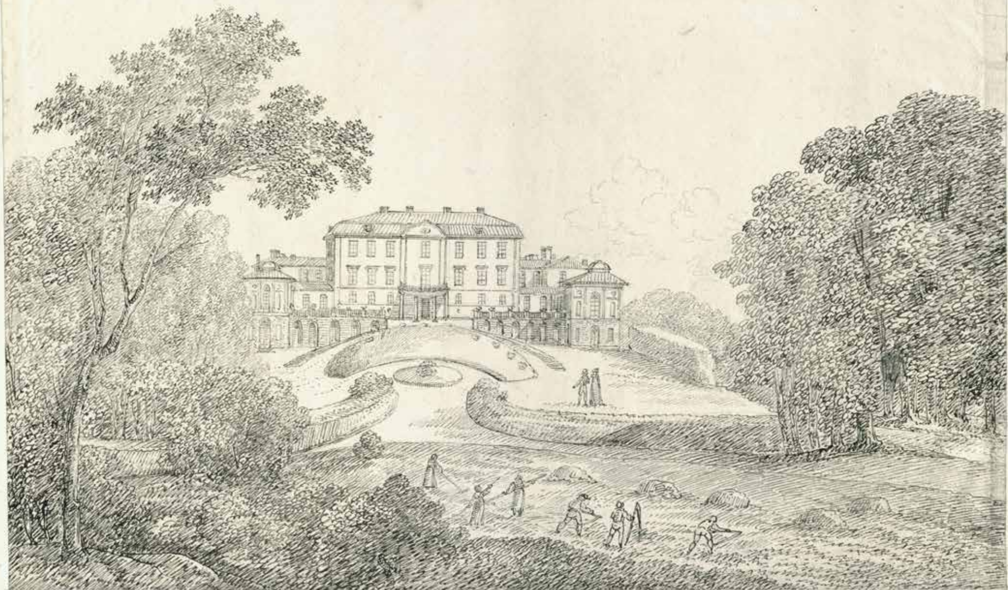
Rosersbergs Slott. Först utgitt efter ritning af A. F. Rodenholmen. 1815.