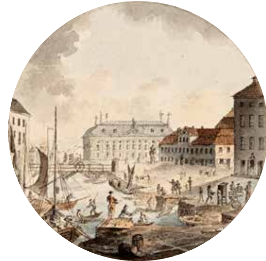
Munkbron med Riddarhuset i bakgrunden. Johan Petter Cumelin, akvarellerad konturetsning, omkring 1780. Stadsmuseet i Stockholm.

Tidningar hade tidigare betytt statens, kungens eller överhetens kungöranden. I den globala marknadsekonomi som växte fram under 1700-talet stärktes behovet av informationsutbyte och nyheter om allt från världsmarknaden till utrikesnyheter. Att varuhandeln och nyhetsförmedlingen gick hand i hand är en av Habermas teser. Nyheter spreds via handelsplatser, hamnstäder och mässor. Informationskanaler i form av prenumerationer på skrivna tidningar var från början avsedda för