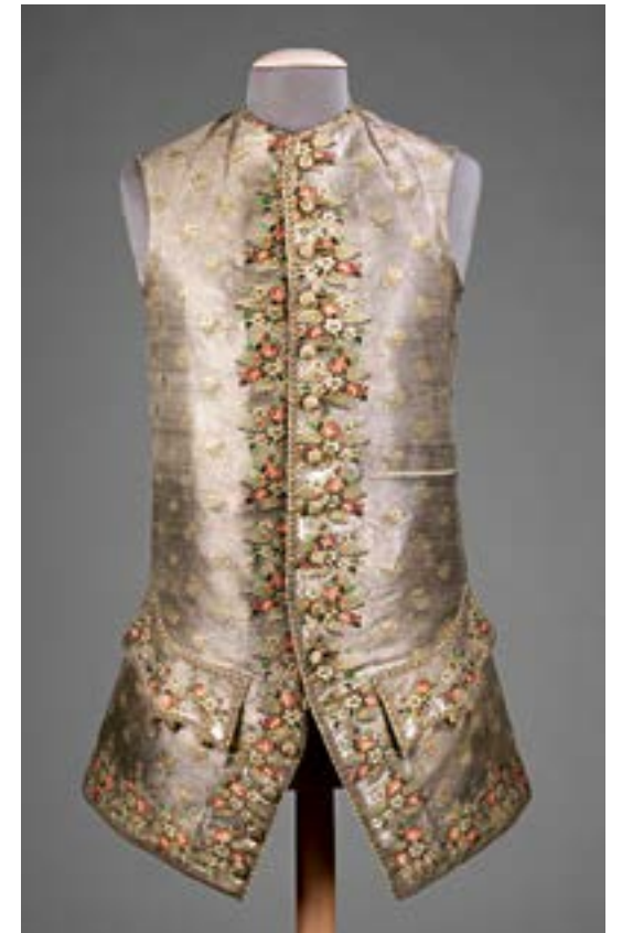
Rikt broderade västar med blomsterornament var en väsentlig del av mäns tredelade kostym under hela 1700-talet. Denna väst av sidentyg, broderad med silkes- och metalltråd och bakstycke i linne är sannolikt av brittiskt ursprung från mitten av 1700-talet. The Metropolitan Museum of Art, New York.