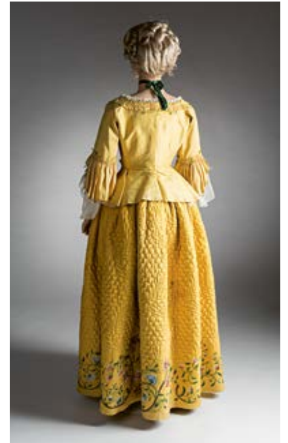
Starka färger var populära vid mitten av 1700-talet. En vaddstickad och broderad kjol var både dekorativ och varm. Denna dräkt i silke från 1765 är fodrad med linne och har använts av en högre ståndsbrud som så kallad annandagsklänning, det vill säga på festen dagen efter vigseln. Finlands Nationalmuseum, Helsingfors.