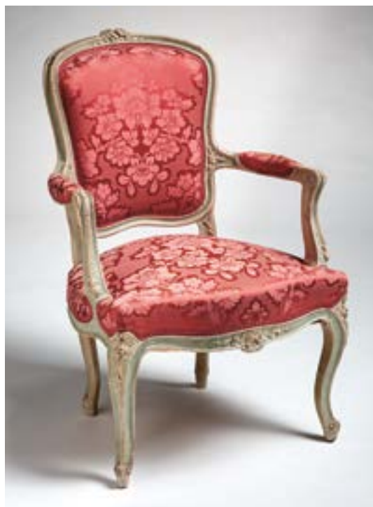
Sittmöblerna under 1700-talet blev mer bekväma än tidigare utan att förlora i ståndsmässigt utförande. Denna fransktillverkade fåtölj har stoppade armstöd, sits och ryggstöd klädda i ett elegant sidentyg och möjliggjorde en avslappnad hållning i salongerna. Finlands Nationalmuseum, Helsingfors.