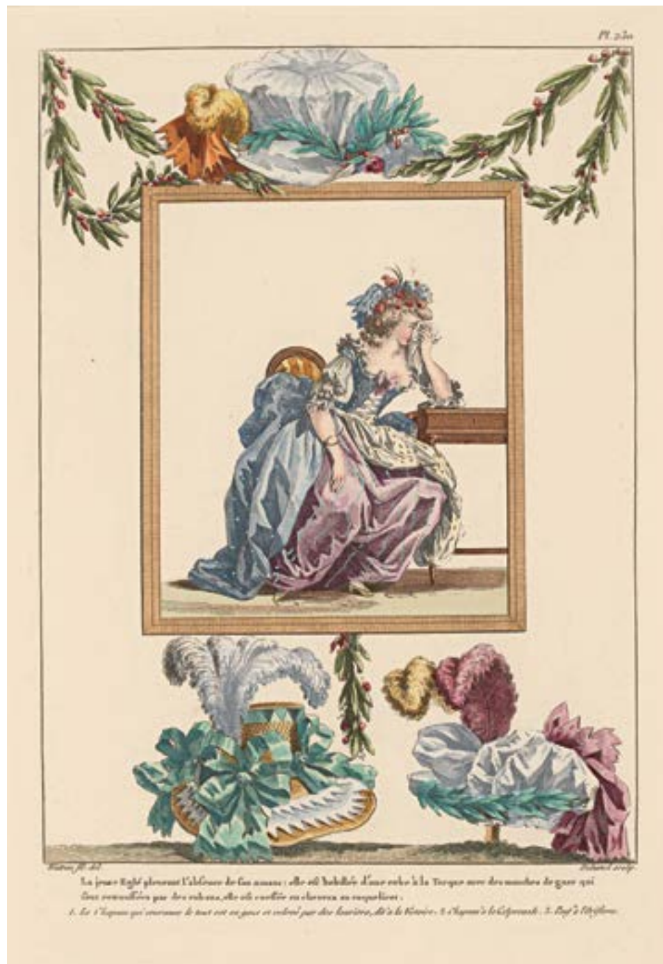
Bonnet à la Victoire kan ses längst ned till höger i den här modegravyn från 1786.

”öronbucklor”, halsband och berlocker. 59 Paulis salubod var således utpräglat fransk inte endast i sin utformning utan även i sitt utbud.