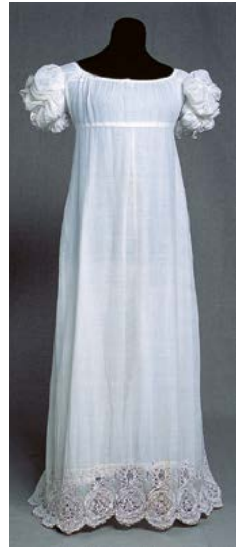
Klänning av tunt bomullstyg, linong, med broderad bård med klumpsöm och infälld knypplad spets, ca. 1805–1810.