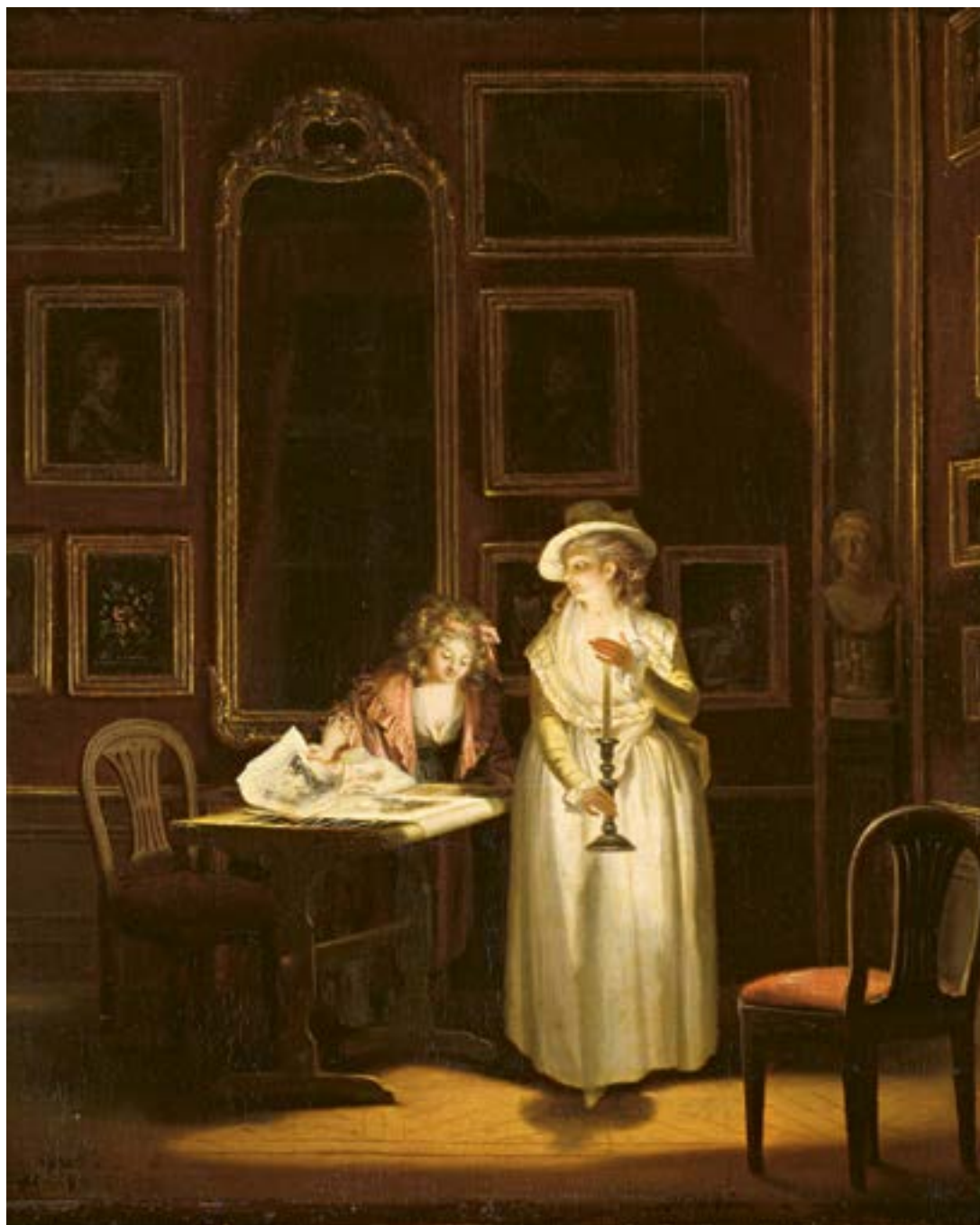
Pehr Hilleström, ca 1790. Två kvinnor vid sybågen beskådar gravyrer som underlag till broderier. Nationalmuseum.