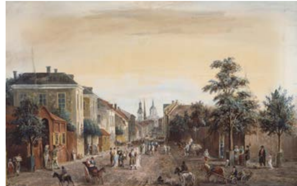
Drottninggatan, Stockholm. Elias Martin 1808. Finlands nationalgalleri, konstmuseet Sinebrychoff.