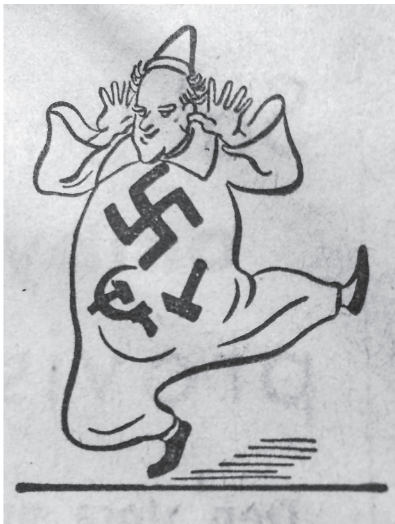
Bild 8. Karikatyr av den politiskt ombytliga Nils Flyg.

Flyg för att han fått de nationella krafterna att inse att folkgemenskap inte kan byggas utan ”rättfärdig inre ordning”. Just det, menade Folkets Dagblads skribent, var också det som Hitler funnit. Och när man en gång skulle värdera samtidens socialistiska strömningar skulle man särskilt se till det tyska exemplet. I Tyskland hade redan funnits en arbetarrörelse, visserligen med andra förtecken än den nationalsocialistiska, men med samma mål: ett likviderande av storfinansens ruttna ordning. Det var den slumrande socialismen från denna tidiga arbetarrörelse som Hitler väckt till liv. Återigen tonar tanken om den tyska revolutionära potentialen fram. 293 Liebknechts och Luxemburgs närvaro skymtas mellan raderna, och såväl Hitlers som Flygs ideologiska resa inrangeras i arvet efter dem.