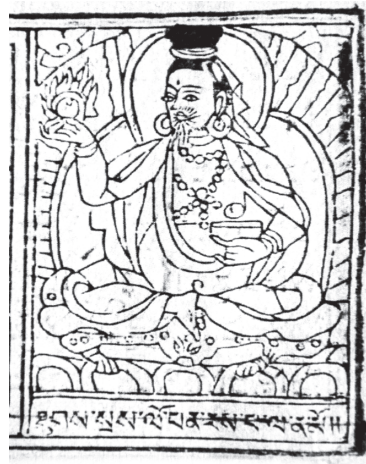
Bild 8. Lopen Jampel Chöla ('Jam dpal chos lha, Yang dgon gyi rnam thar : 75b).