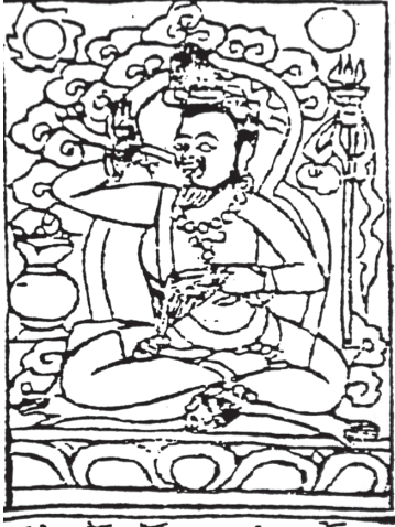
Bild 3. Tsangnyöns bror Könchog Gyaltzen (dNgos grub dpal 'bar, Dad pa'i seng ge : 1b).