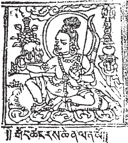
Bild 7. Götsangrepa (rGod tshang ras pa, Nyi ma'i snying po : 287).